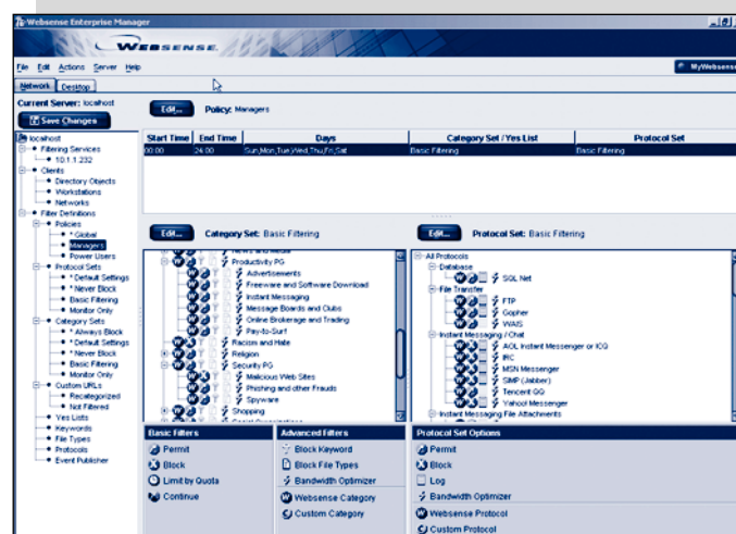
Le categorie dei Premium Group si integrano in modo trasparente con Websense Enterprise Manager.